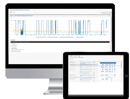
Fehlererkennung und - diagnose

Dank dieser Zusammenarbeit wurde die Unterstützung aller Beteiligten vor Baubeginn sichergestellt und Nacharbeiten während der Beta-Testphase der Gebäudesysteme minimiert.